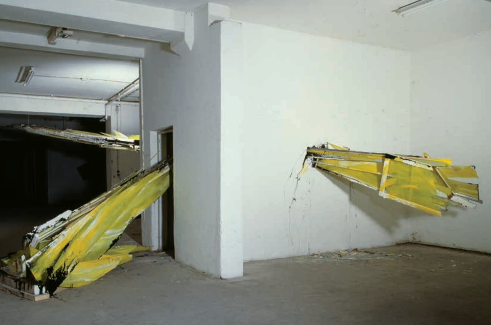
Durchbruch, Abriss-Installation für So zu sehen , Holz, Glas, Farbe, Teer; Künstlerwerkstatt Lothringer Str. München 1984