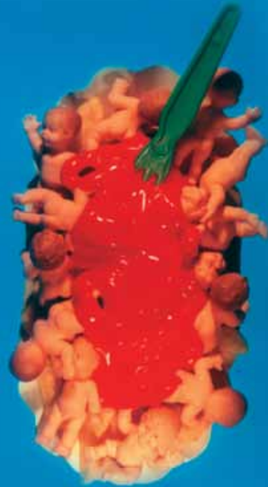
Fast Food Babies (1998)