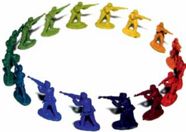
Reasons to be Cheerful Pt. 3 (2009)