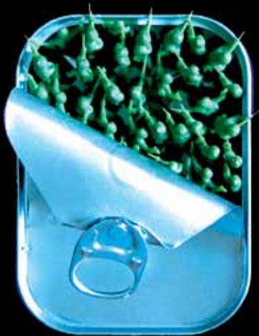
Mindestens Haltbar bis (siehe Bodenprägung) (2012)