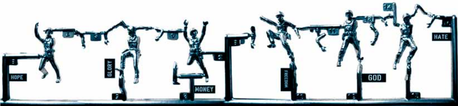
Soldier Ballet (2012)