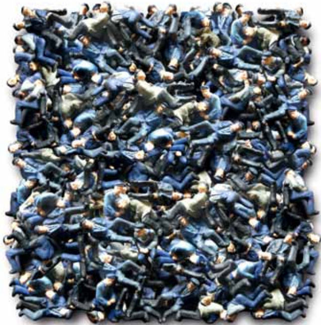
Proletarian Rhapsody I (2012)