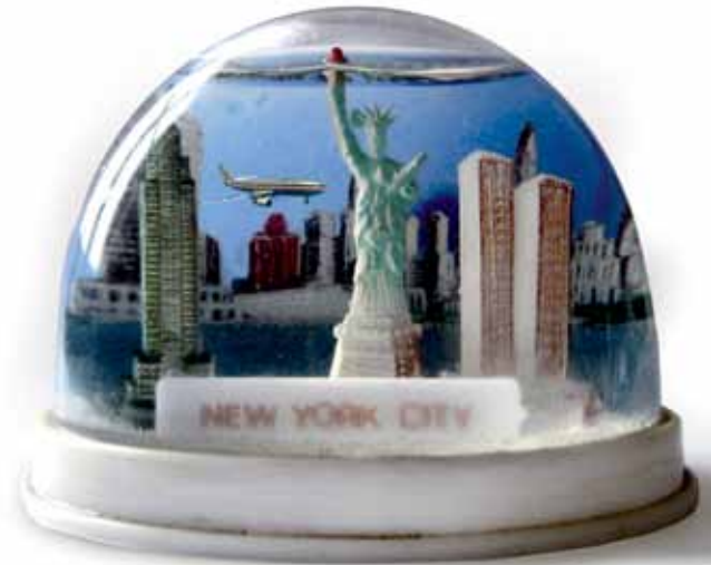
Sometimes it snows in September (2010)