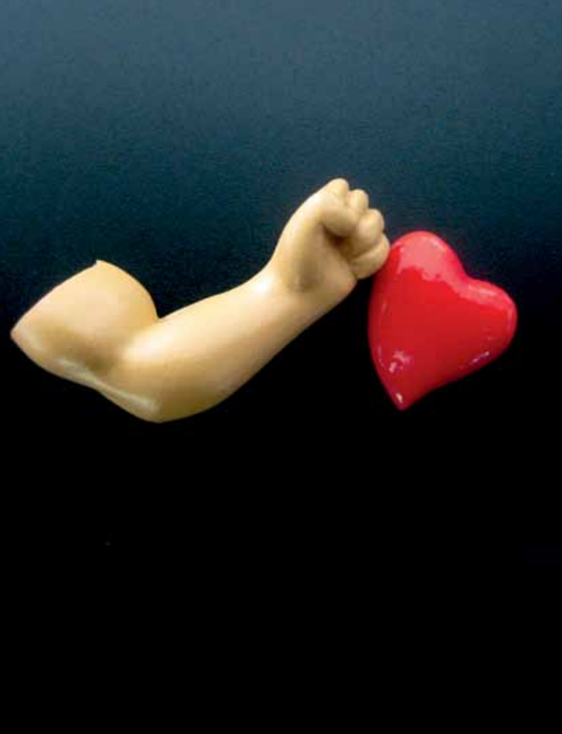
Raw Power (2011)