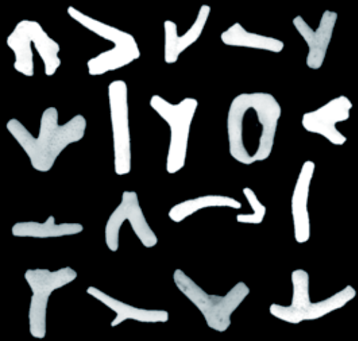
Balinese Coral Alphabet (1994)