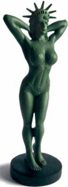
The Statue of Bigotrie (2012)