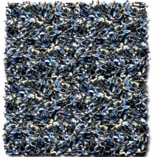
Proletarian Rhapsody 2 (2012)