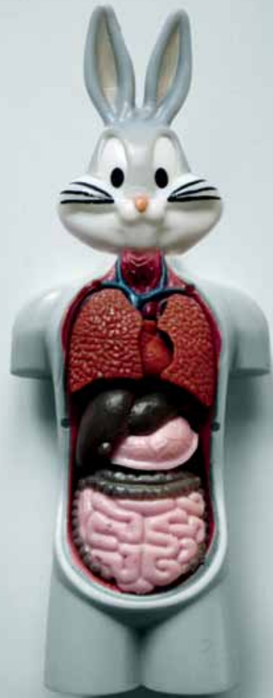
Bunny Autopsy (2012)