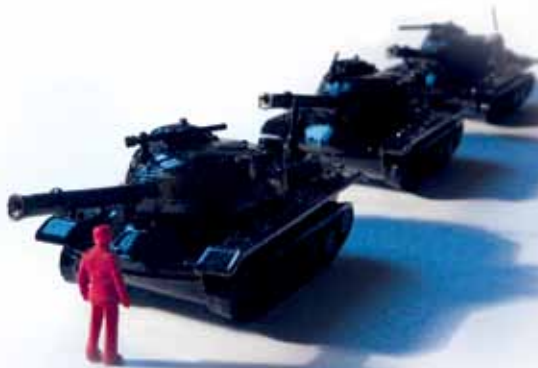
Tianamen Square (2012)