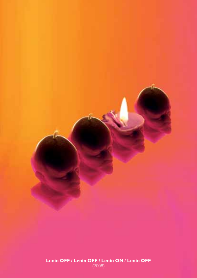
Lenin OFF / Lenin OFF / Lenin ON / Lenin OFF (2008)