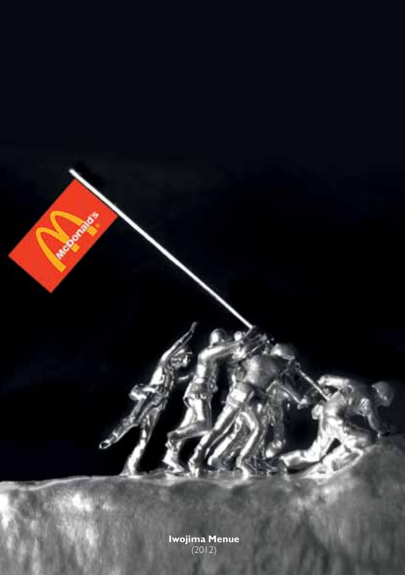
Iwojima Menue (2012)