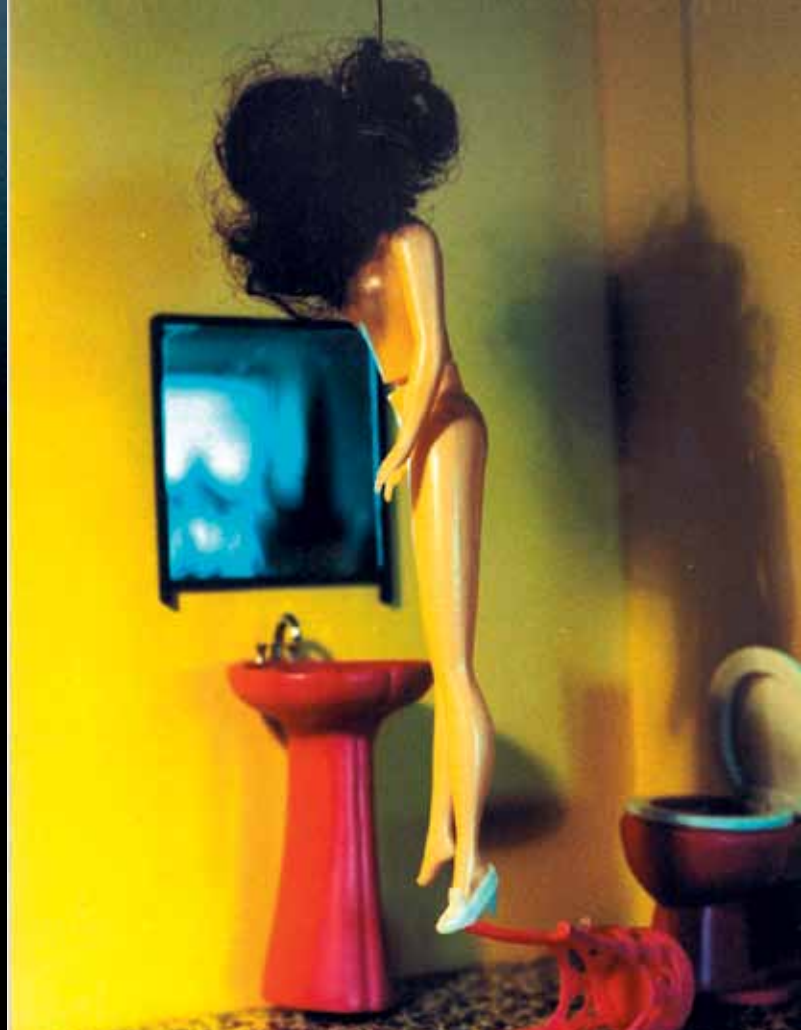
Suicide Barbie (1998)