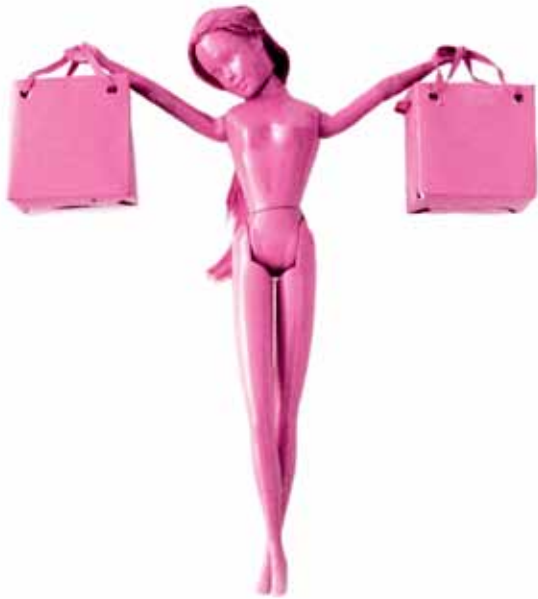
The Gospel According to Heidi Klum (2012)