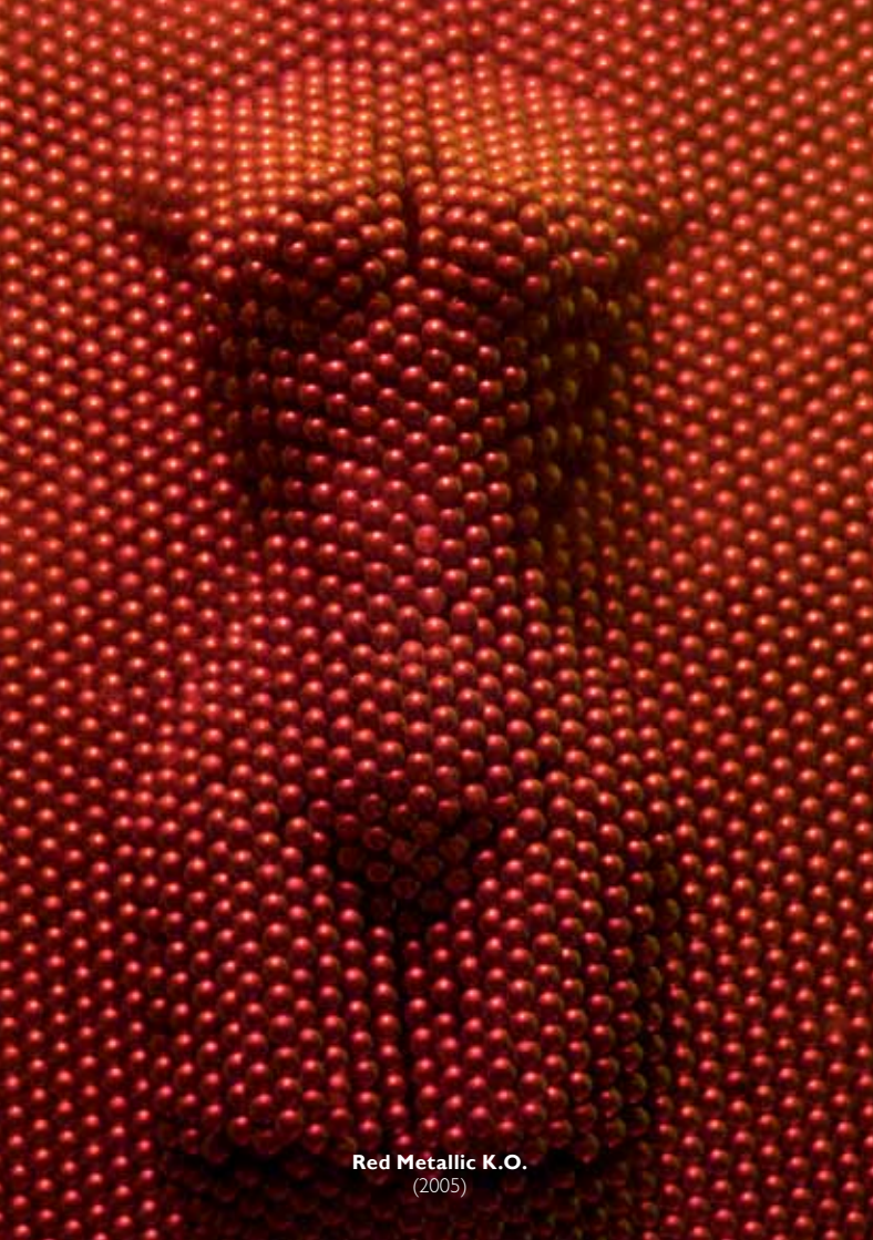
Red Metallic K.O. (2005)